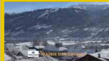
Site internet mis à jour