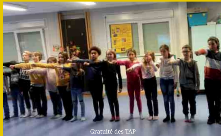
Gratuité des TAP