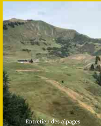
Entretien des alpages